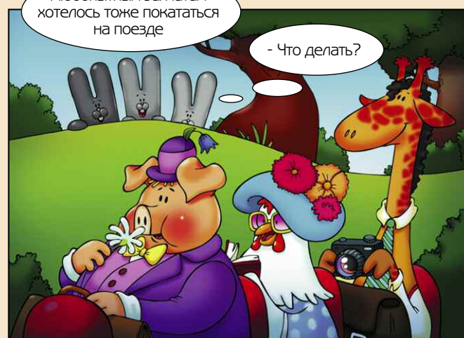
Любопытным зайчатам хотелось тоже покататься на поезде