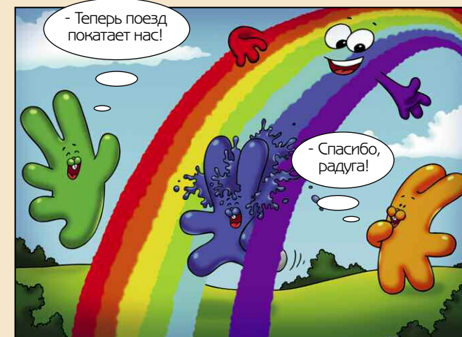
- Теперь поезд покатает нас!