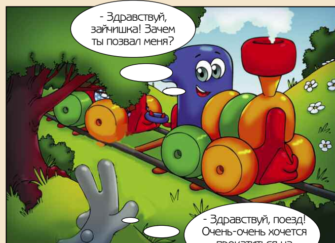
- Здравствуй, зайчишка! Зачем ты позвал меня?