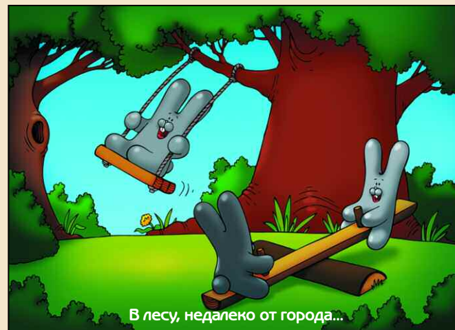
В лесу, недалеко от города...