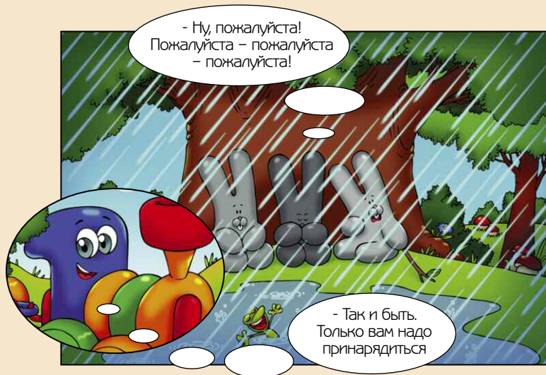
- Ну, пожалуйста! Пожалуйста – пожалуйста – пожалуйста!