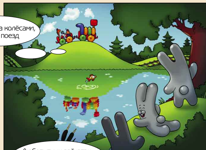
Весело стуча колёсами, мчался поезд